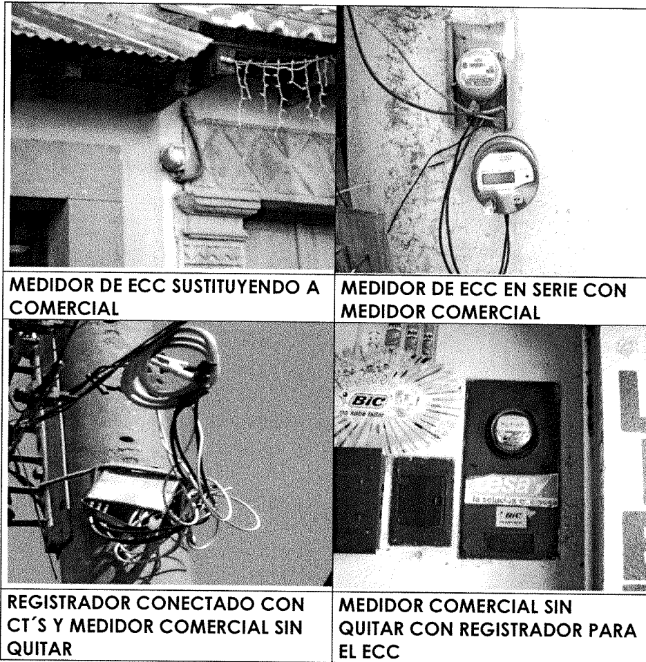
MEDIDOR DE ECC SUSTITUYENDO A COMERCIAL